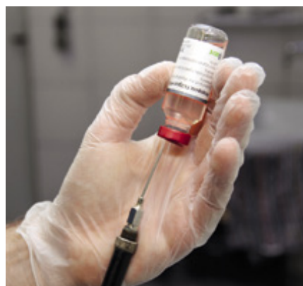
Der neue Impfstoff gegen das pandemische Influenzavirus pdmH1N1.

Nasentupferproben, die der Tierarzt auf der Insel Riems untersuchen ließ, bestätigten dann den Verdacht, dass es sich um eine Infektion mit dem pandemischen Influenzavirus handelte.